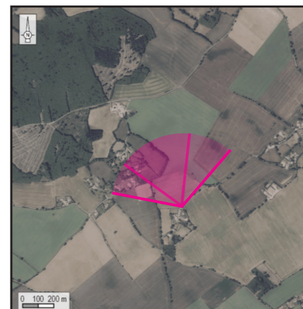
Orthophotographie 1 / 25 000